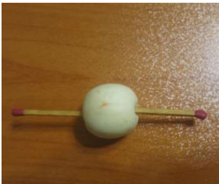
شکل ۱. آرایش خطی مولکول \text{HgCl}_2

۴-آزمایش: در این قسمت گروه اقدام به اجرایی نمودن طرح یا حل مسئله می‌کند و با استفاده از امکانات و ابزاری که از قبل تهیه و به آنها معرفی شده است طرح خود را اجرا می‌کنند. آموزشگر در این مرحله نقش ناظر داشته و از ارائه هرگونه راهنمایی یا اعمال نظر باید خودداری نماید. در آموزش قاعده‌ی VSEPR و پیش‌بینی شکل هندسی مولکول‌ها دانشجویان با استفاده از خمیر مجسمه‌سازی و چند چوب کبریت و یا هر وسیله‌ی دیگری که خود مناسب می‌دانند، اقدام به ساخت مدل و شکل هندسی مولکول‌ها براساس طرح‌های پیشنهادی خود می‌نمایند مانند، شکل ۱ و ۲.