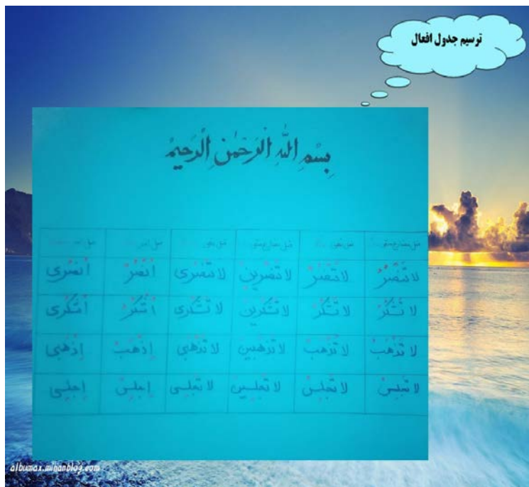
مثلاً با ساخت جدول رمزدار و مقاطع عربی