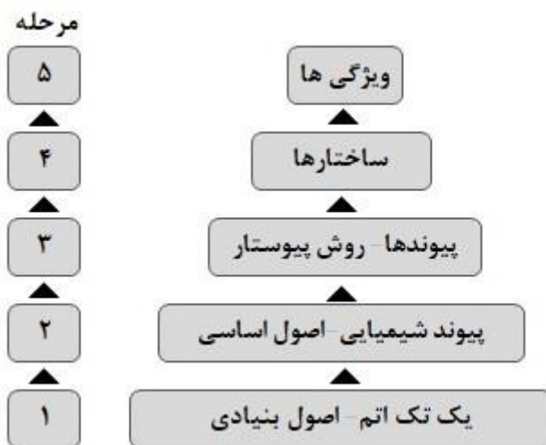
شکل ۱- شمای پایین به بالا برای آموزش پیوند شیمیایی

در معرض مفاهیم و ایده‌های اصلی و در طی پنج مرحله، دسته‌بندی ساختگی دوگانه بین انواع مختلف پیوند را برطرف می‌کند. در شکل ۱، شمای پایین به بالا برای آموزش پیوند شیمیایی نشان داده شده است (لوی ناهوم و دیگران، ۲۰۱۰، ص. ۱۷۹).