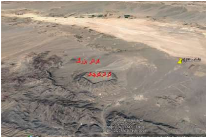
شکل ۶: کراتر آغل کوه در جنوب دشت مختاران و دق اکبرآباد

در حاشیه کفه و در قسمت مرکزی آن مجموعه سنگ‌های آذرین مشاهده می‌شود. مجموعه‌های آذرین از نظر سنی بیشتر متعلق به پالئوژن می‌باشند که بیشتر در جنوب کفه مختاران گسترش دارند. این مجموعه از نظر سنگ‌شناسی شامل میکرودیوریت، آندزیت بازال، داسیت و انواع توف می‌باشد. در بین این مجموعه سنگی دو ساختار زیبا در منطقه دیده می‌شود. یکی از این ساختارها به نام آغل گیوشاد شناخته می‌شود. آغل گیوشاد دارای ساختمانی مدور است و ترکیب سنگ‌شناسی آن میکرودیوریت می‌باشد که نزدیکی روستای گیوشاد قرار دارد. ساختار مشابه دیگری نیز در جنوب روستای هردنگ در جنوب کفه نیز مشاهده می‌شود که به نام آغل کوه مشهور است (شکل ۶). بنابر مطالعات انجام‌شده (Master et al., 2014, Khatib and zarrin koup, 2009) این ساختار ناشی از فروریزش یک قله آتشفشانی است. فرونشستن و ریزش فوقانی مخروط آتشفشان باعث ایجاد این نوع کراتر می‌گردد. به عبارت دیگر یک کراتر کوچک در داخل یک کراتر بزرگ‌تر قرار گرفته است. هر دو ساختار از پدیده‌های ژئوتوریسم جالب و منحصر به فرد در خراسان جنوبی محسوب می‌شوند.