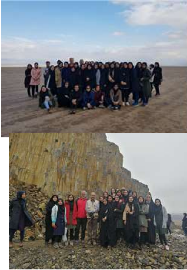
شکل ۴: دق اکبرآباد دشت مختاران و منشورهای بازالتی سربیشه