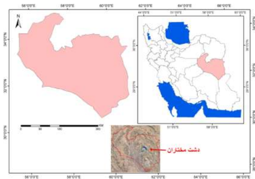
شکل ۱ دشت مختاران و موقعیت قرارگیری آن در استان خراسان جنوبی

دشت مختاران به علت قرار گرفتن در مجاورت بیابان لوت دارای آب‌وهوای خشک و سرد می‌باشد. اختلاف درجه حرارت در طول شبانه‌روز در فصول مختلف سال زیاد بوده آگاهی به ۵۰ درجه سانتی‌گراد می‌رسد و حداکثر مطلق آن ۴۴ درجه سانتی‌گراد، حداقل مطلق آن 21/5 - درجه سانتی‌گراد و میانگین دمای سالانه 14/16 درجه سانتی‌گراد ثبت شده است (رئیس‌السادات و معتمدالشریعتی، ۱۳۹۸). منطقه مورد مطالعه از سه واحد ژئومورفولوژی تشکیل گردیده است که عبارت‌اند از: واحد کوهستان، واحد دشت‌سر و واحد پلایا یا چاله داخلی تقسیم می‌شود. ارتفاعات غالباً دارای روند شمال غرب - جنوب شرقی و شرقی- غربی می‌باشند. با توجه به نقشه‌ی توپوگرافی ترسیم‌شده دشت مختاران، بلندترین نقطه این ناحیه در ارتفاعات رشته‌کوه باقران با ارتفاع ۲۶۴۶ متر در شمال دشت مختاران و پست‌ترین نقطه دارای ارتفاع ۱۲۸۵ متر از سطح دریاهای آزاد در مرکز دشت می‌باشد (شکل ۲).