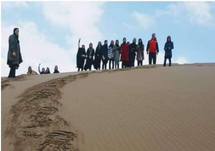
شکل ۵: تپه‌های ماسه‌ای دشت مختاران

باد با برداشت مواد و ماسه‌های ریز در سطح مخروطه‌افکنه‌های بهم‌پیوسته و انباشت دانه‌های درشت‌تر به‌ویژه ریگ‌ها باعث پیدایش دشت ریگی در دشت مختاران شده است.