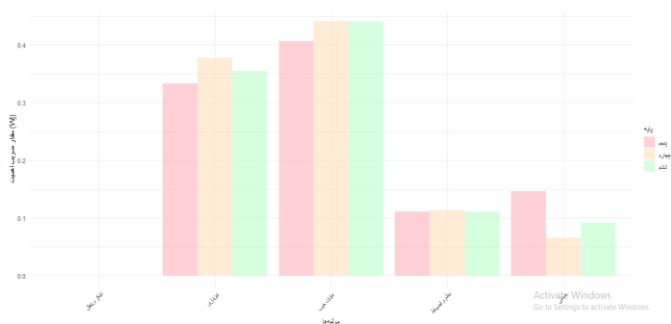
شکل ۲. مقدار ضریب اهمیت (Wj) مولفه‌ها در کتاب فارسی پایه‌های چهارم، پنجم و ششم ابتدایی