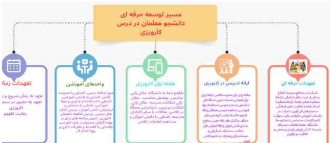
شکل ۲. مسیر توسعه حرفه ای دانشجو معلمان در درس کارورزی