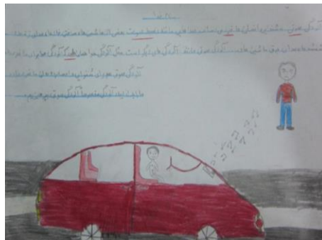
تصویر (۲) سه نمونه از املا و اسناد (شواهد ۲) نتیجه‌گیری