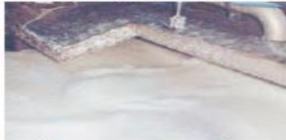
(۵) تبدیل تنه‌های ریز چوب به خمیر و از بین بردن رنگ آن

۱- تغییرهای انجام‌شده در هر یک از مرحله‌های (۴) و (۶) فیزیکی است یا شیمیایی؟