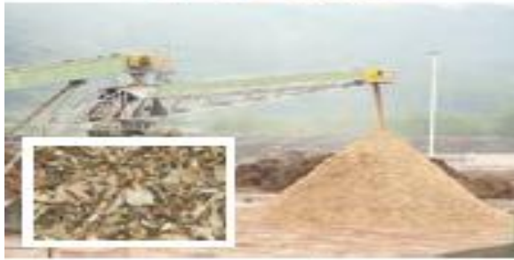
(۴) تبدیل به تنه‌های ریز چوب (چوبس چوب)