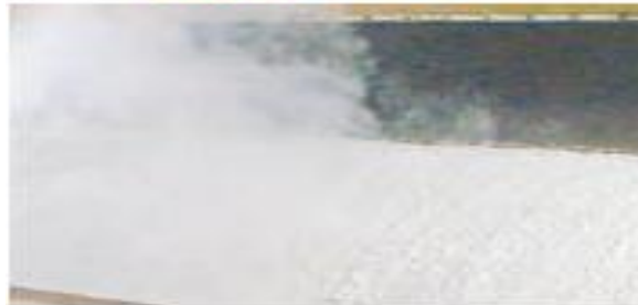
(۶) خشک کردن خمیر و تهیه کاغذ