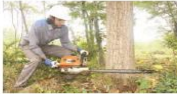
(۱) بریدن درخت