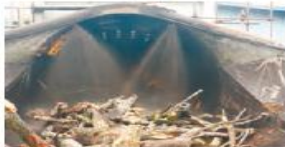
(۳) کندن پوست تنه درخت