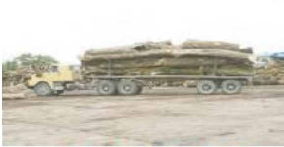
(۲) حمل اتوار چوب و تنه‌های درخت به کارخانه

از میان اجزای تشکیل دهنده درخت، فقط ساقه و تنه محکم و شاخه‌های چوبی درختان تنومند برای تهیه کاغذ مناسب است. در شکل‌های زیر، مراحل مختلف تبدیل درخت به کاغذ نشان داده شده است. با توجه به آنها و اطلاعاتی که جمع‌آوری کرده‌اید دریابید هر مرحله در کلاس گفت‌وگو کنید؛ سپس به پرسش‌ها پاسخ دهید.