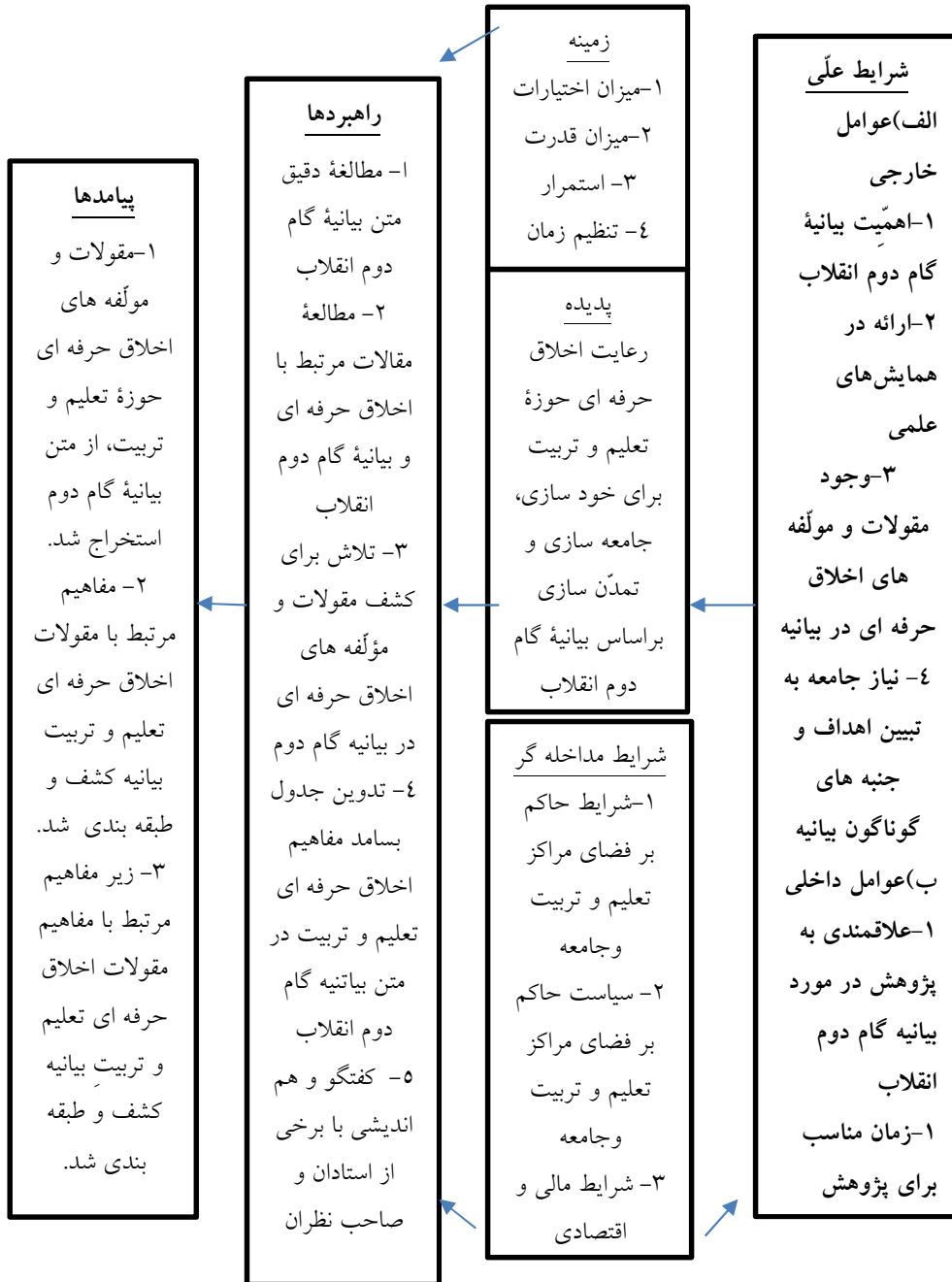
نمودار ۳- نظریه داده بنیاد الگوی کدگذاری بصری

شکل روایی نوشته می شود. (دانایی فرد و امامی، ۱۳۸۶: ۸۹) لذا با توجه به گویایی و اختصار در این پژوهش از الگوی کدگذاری بصری استفاده شده است.